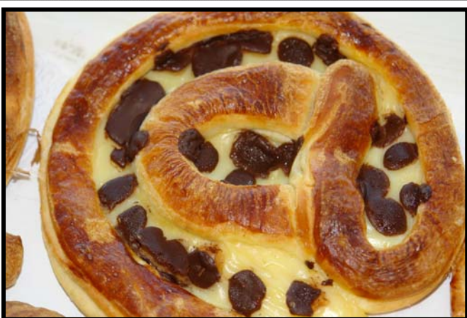
“Recién salidas del horno del Gremio Artesanos Confiteros del Principado de Asturias, os paso las primeras imágenes de la @Dulce”.

La comida es el momento de encuentro por excelencia para la celebración social y festiva que reúne en torno a la mesa a familiares, amigos, compañeros y conocidos. De todos es sabida la asociación de determinados postres con unas fechas concretas como el roscón de Reyes, las torrijas de Semana Santa o el huevo de Pascua.